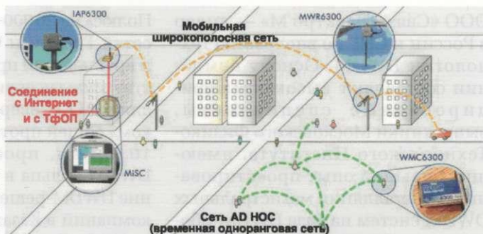
Рис. 1. Пример использования MotoMesh Solo