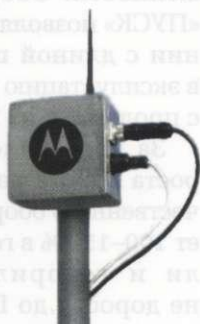
Точка доступа IAP 6300